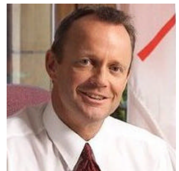
Stockwell Burt DAY

Minister für öffentliche Sicherheit Minister of Public Safety