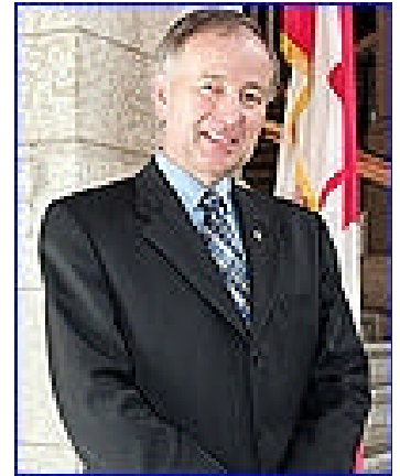
Robert Douglas NICHOLSON

Minister für Justiz und Oberster Generalstaatsanwalt Minister of Justice and Attorney General