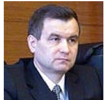
Rashid Gumarovich NURGALIJEV

Minister des Innern Minister of the Interior