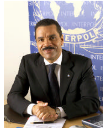
Ronald K. NOBLE